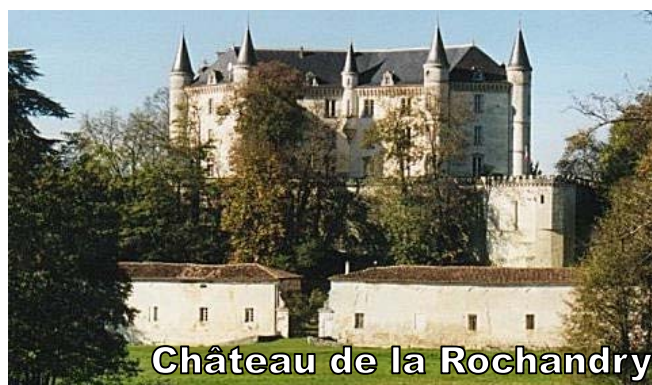
Château de la Rochandry